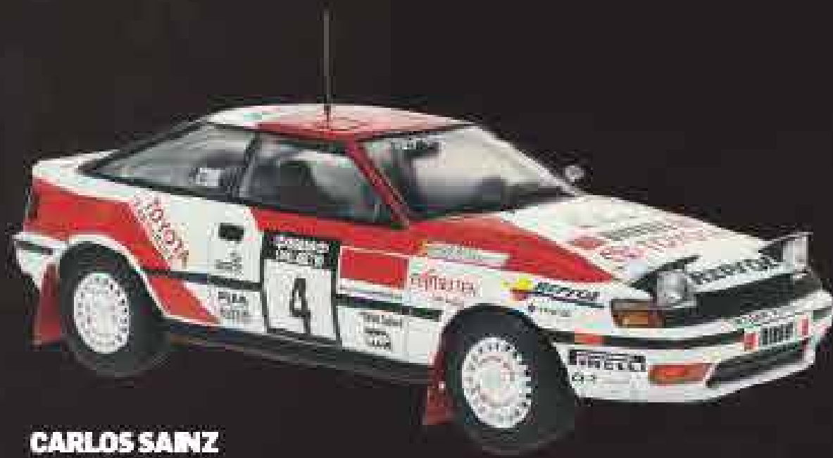
CARLOS SAINZ LUIS MOYA

Uma das melhores viaturas da geração WRC, vencedora de quatro provas em 2019. No seu exclusivo tom de azul, levou Thierry Neuville ao segundo lugar no campeonato nesta temporada.