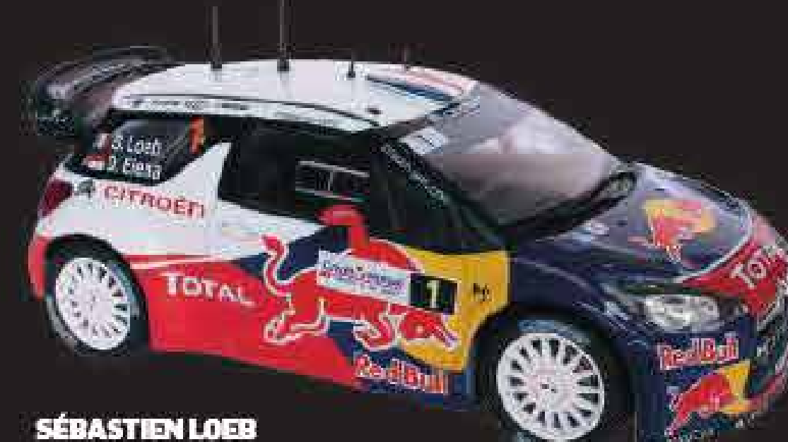
SÉBASTIEN LOEB DANIEL ELENA

A extensa lista de sucessos deste modelo, cujas 300 unidades produzidas obtiveram mais de 1000 vitórias entre 2015 e 2019, tornaram-no um dos veículos com mais vitórias na história dos ralis.