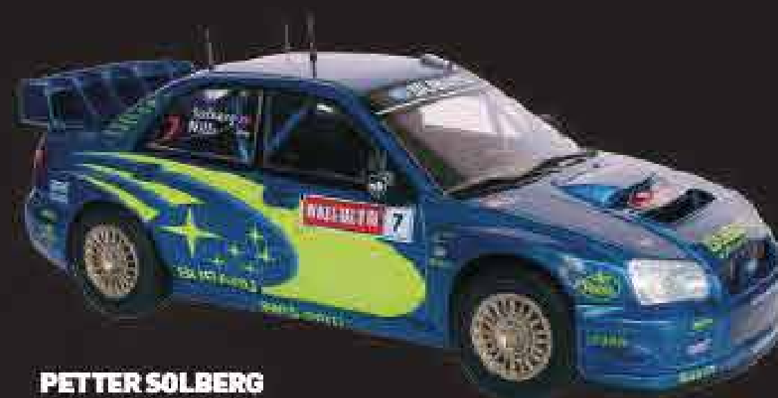
PETTER SOLBERG PHIL MILLS

Vencedor de 13 provas do Campeonato do Mundo de Ralis entre 1988 e 1992, o Toyota Celica GT-4 foi a máquina com que Carlos Sainz se sagrou campeão mundial na temporada de 1990.